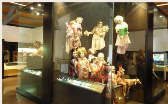
MUSEO DE TITELLES Y DE BELENES